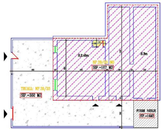
PLANIMETRIA E KATIT TE PARE